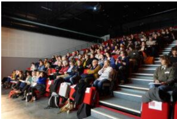
Journée culture et travail social à Angers.

La coordination du programme Respirations en région repose sur des comités de pilotage (COFIL). En 2024, ces COFIL se sont réunis 62 fois dans les treize régions impliquées, soit en moyenne 4,8 COFIL par région .